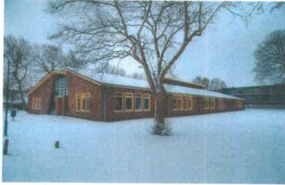
'een warm dak boven ons hoofd'