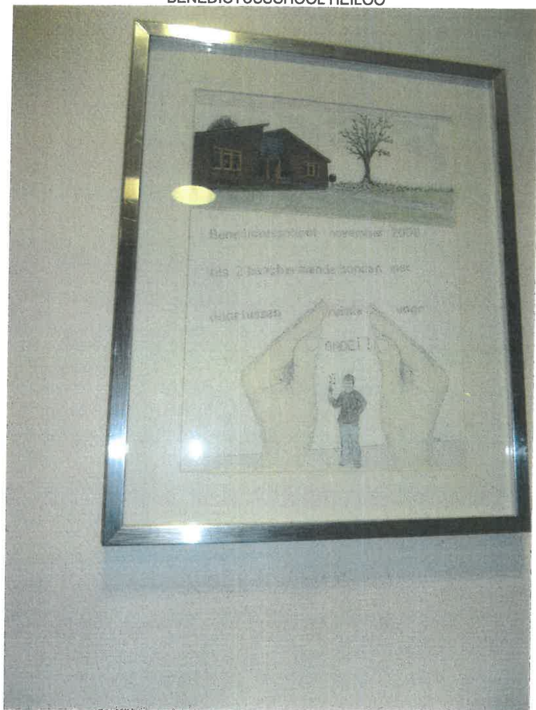
Door de ogen van oma Bijkerk (van leerling groep 4)